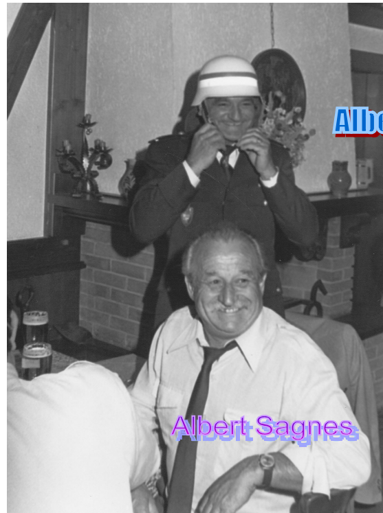
C'est un vieux routier du Sapeur Pompiers Sarrians!

hinweg den Austausch zwischen den Feuerwehren von Sarrians und Biebental begleitet und gefördert hat.