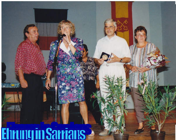
Ehrung in Sarrians