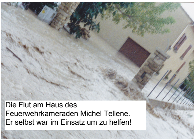
Die Flut am Haus des Feuerwehrkameraden Michel Tellene. Er selbst war im Einsatz um zu helfen!

1992, am 20. August, wurde Sarrians, wie auch Nachbargemeinden, von einer Wasserwelle überflutet, die aus einem Unwetter resultierte, welches solche Wassermengen brachte, dass die Betoneinfassung eines Regenrückhaltebeckens zerbarst. Von Biebertal aus schwappte daraufhin eine große Welle der Hilfsbereitschaft nach Sarrians. Auch die Feuerwehren beteiligten sich aktiv daran.